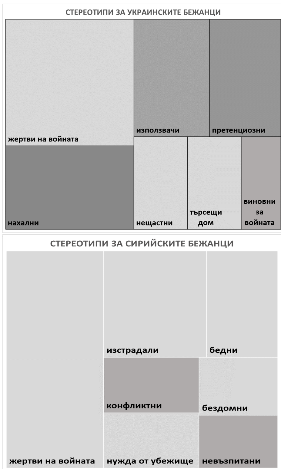
Фиг. 1. Стереотипи за украинските и сирийските бежанци

И в двата случая обаче остава въпросът: защо, при относително високи нива на емпатия към тези бежански групи, те все пак остават по-скоро нежелани като съседи – и за българите, и за ромите; и ако трябва ние да се местим, и ако те искат