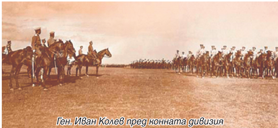
Ген. Иван Колев пред конната дивизия

И летописецът, и поетът са еднородни в припознаването на българските офицери и войници, участници в Добричката епопея, като творци на българската бойна слава! А театърът на бойните им действия - град Добрич, с основание бе признат еднородно от Народното събрание за „Град на Българската бойна слава!“