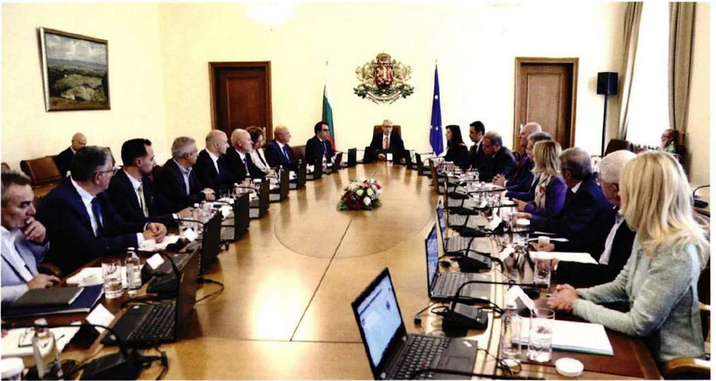
Кабинетът „Денков“ дойде на власт с призив за успокояване на противопоставянето в парламента и политиката изобщо

кабинетът „Денков“, трябва да дадат възможност на обществото ни поне леко да се успокои от лошите новини, които застигнаха България в последните години. Инфлация, близка война, правителствена и партийна криза, пандемия, бежанци – всичко това се случи почти по едно и също време и заедно с агресивното говорене на политиките засили впечатлението, че „всеки сам си решава“ и трябва да се оправя единствено с оглед на собствените си интереси. Визия, която неслучайно се появи и придоби сили по време на дългото управление на ГЕРБ – период, в който се загубиха и без това изтънелите ценностни ориентири на взаимоотношенията човек – човек и човек – държава. Но за миналото ще има време да говорим тогава, когато търсим причини за успеха или неуспеха на това управление. В случая е важно, че кабинетът „Денков“ дойде на власт именно с реализиран призив за успокояване на противопоставянето в